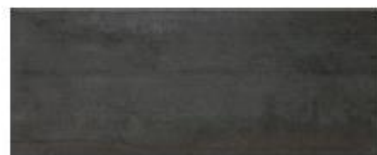
Oxígeno Black 20x50 / 8x20"