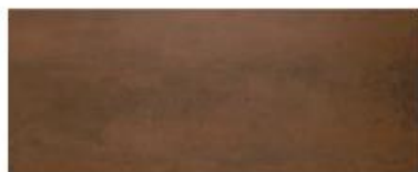
Oxígeno Brown 20x50 / 8x20"