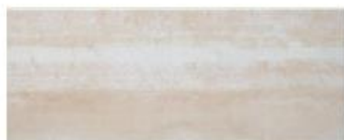
Oxígeno Beige 20x50 / 8x20"