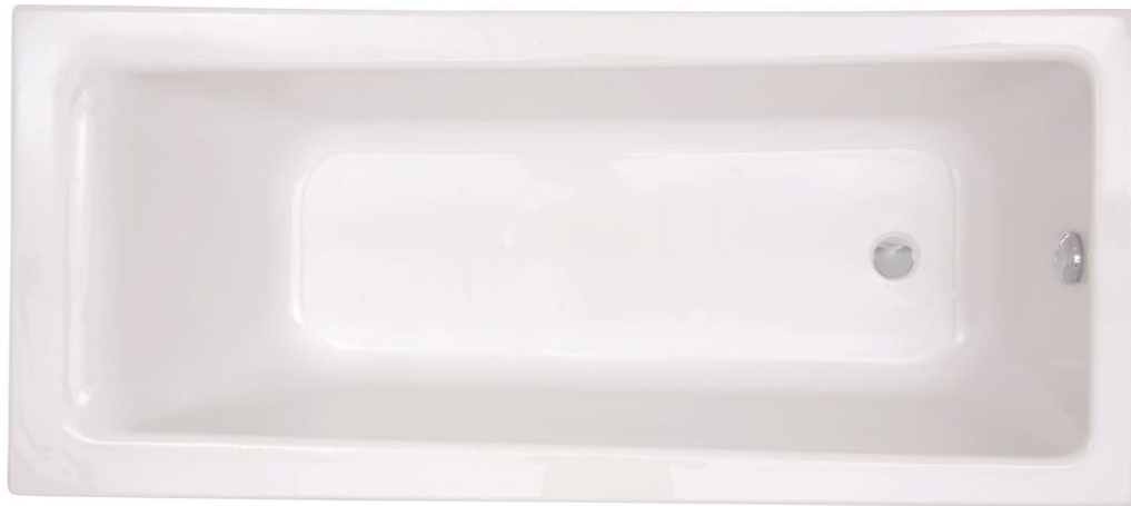
Vana, Vitra CONCEPT