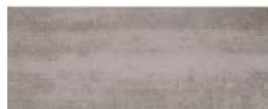
Oxígeno Grey 20x50 / 8x20"