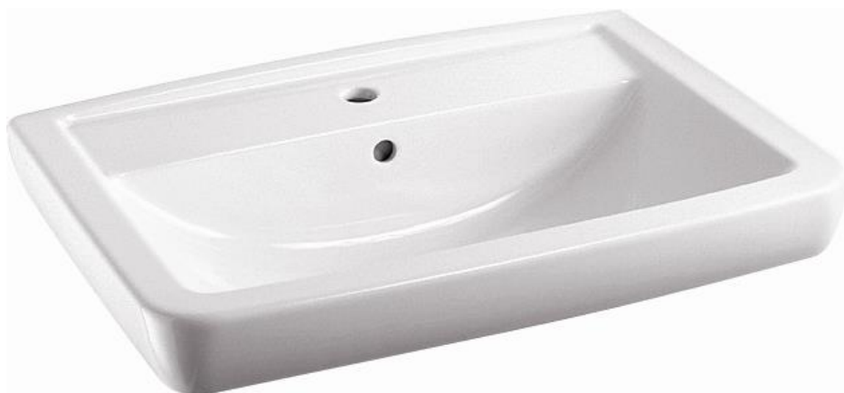
Umyvadlo, Vitra Concept 100