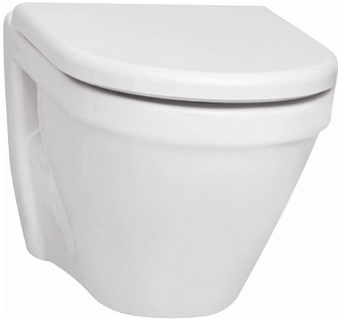
WC závěsné, Vitra S50